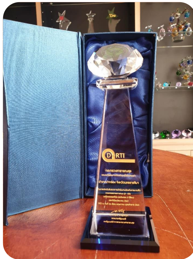
อำเภอระดับทองแพลทินัม (ระดับทอง 3 ปีซ้อน) จำนวน 12 อำเภอ