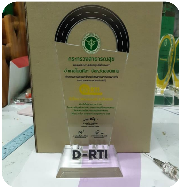
อำเภอ (D - RTI) ดีเยี่ยม ระดับทอง จำนวน 36 อำเภอ