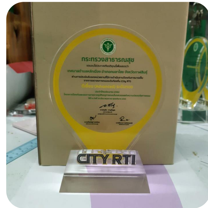
ระดับท้องถิ่น (City RTI) ระดับทอง จำนวน 7 หน่วยงาน